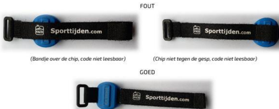
(Bandje over de chip, code niet leesbaar)

Daarbij zou het erg fijn zijn wanneer de bandjes van de chips goed dicht gevouwen zijn en de chip tegen het gespje geschoven is, zoals hier onder. Op deze manier kunnen wij ze weer makkelijk sorteren en kleven ze niet aan elkaar.